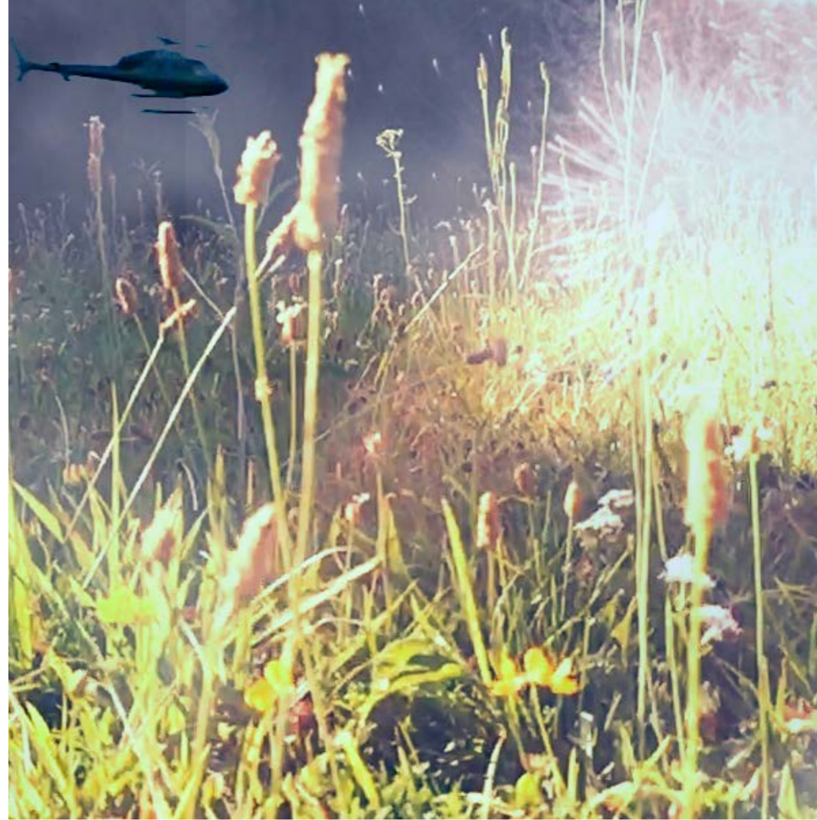
Neil Lang, Bee Wars, 3' 23", 2018