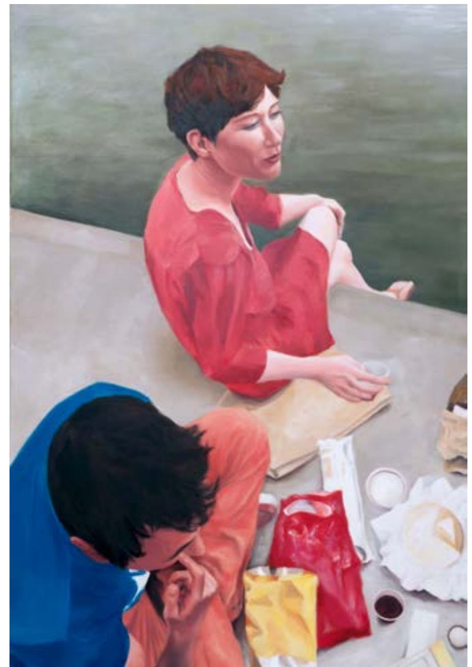
Alexandre Carin, Torsion , 2014, Huile sur toile, 145 x 100 cm, 2014