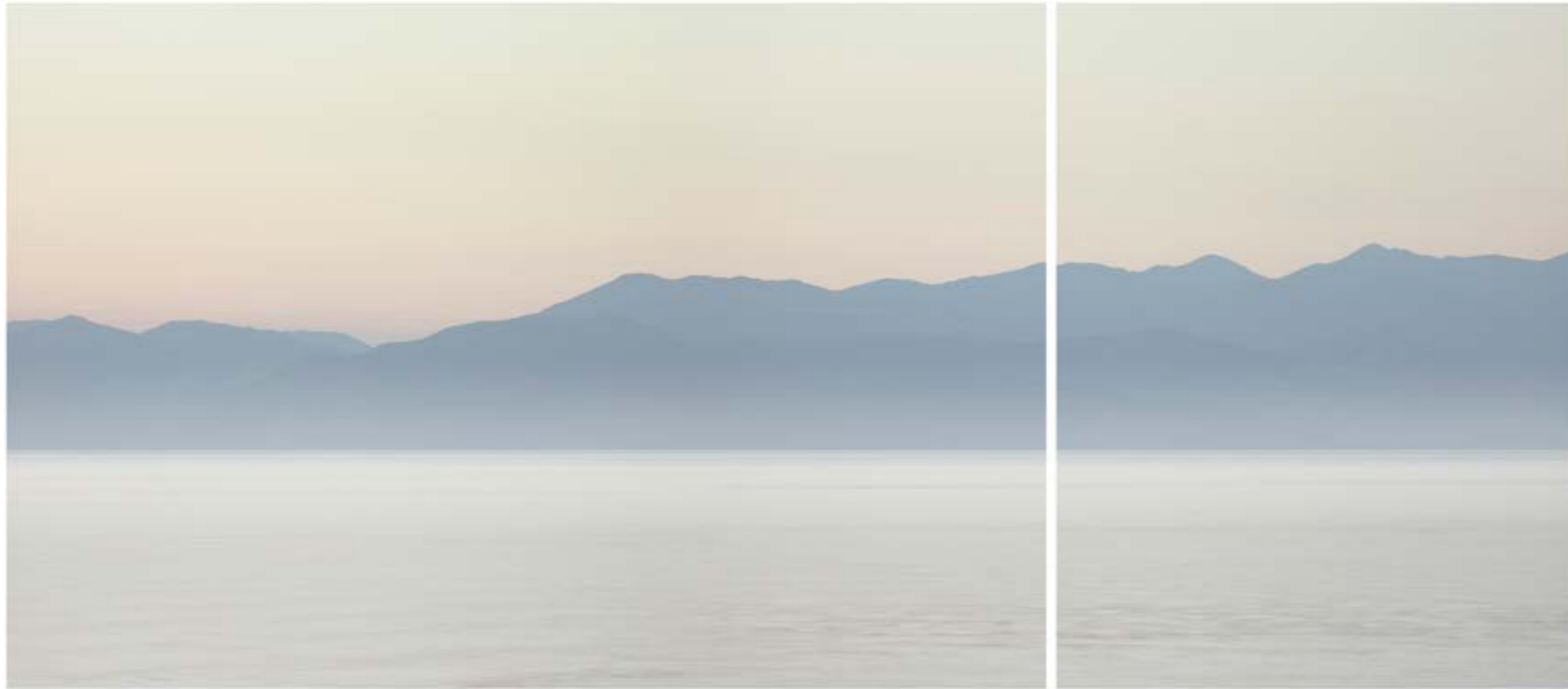
Stephan Crasneanski, Delphi , Ulysses Syndrome series , 80 x 180 cm, 2017