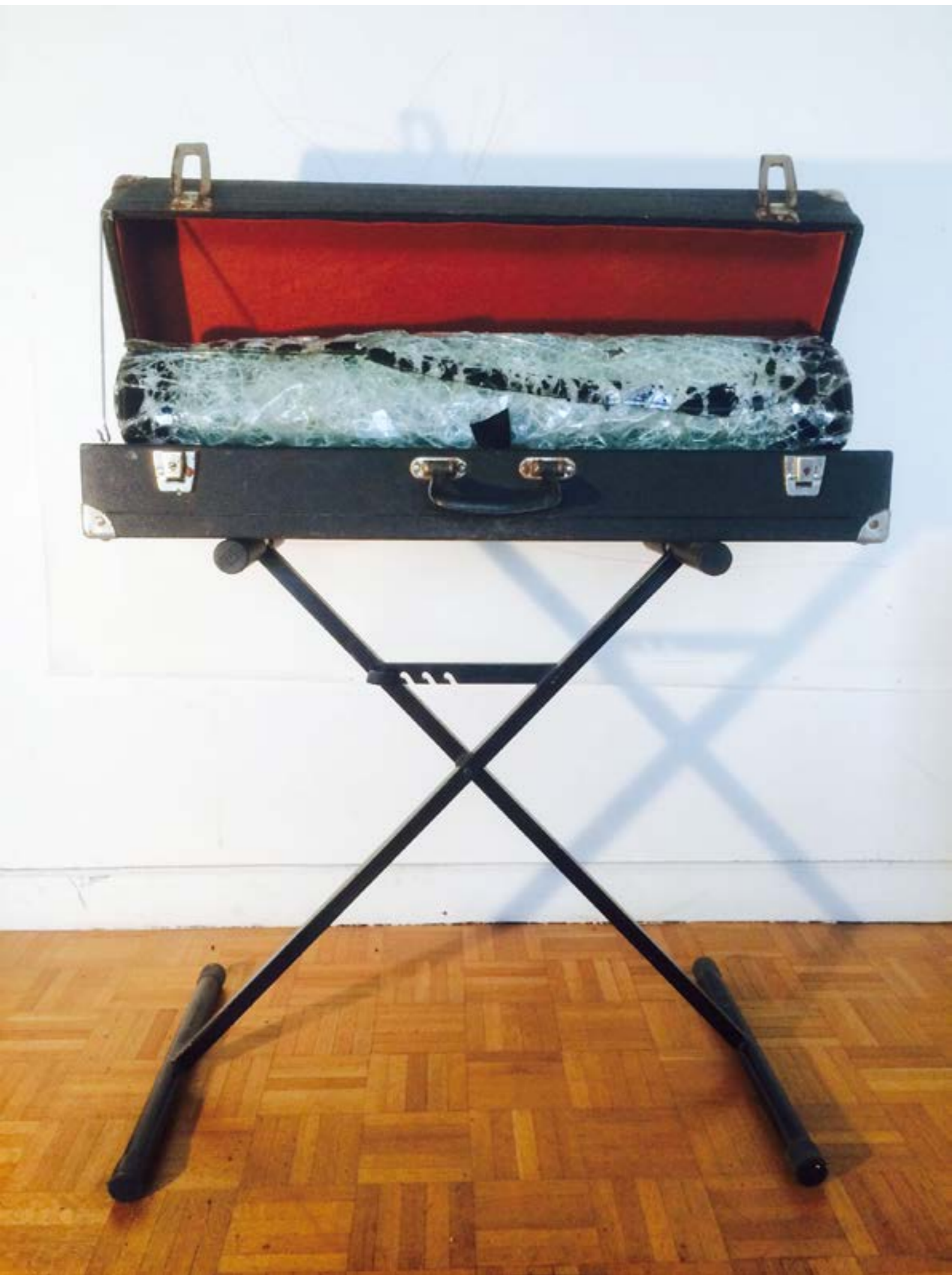
Guillaume Cabantous, Sans Titre , matériaux mixtes, 100x30 cm, 2019