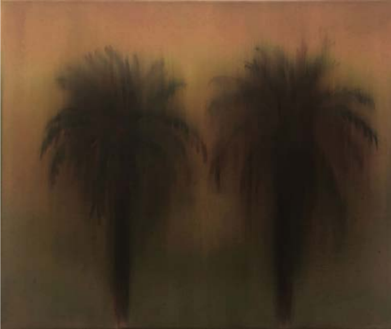
Coraline de Chiara, Napalm love, 55x46 cm, 2019