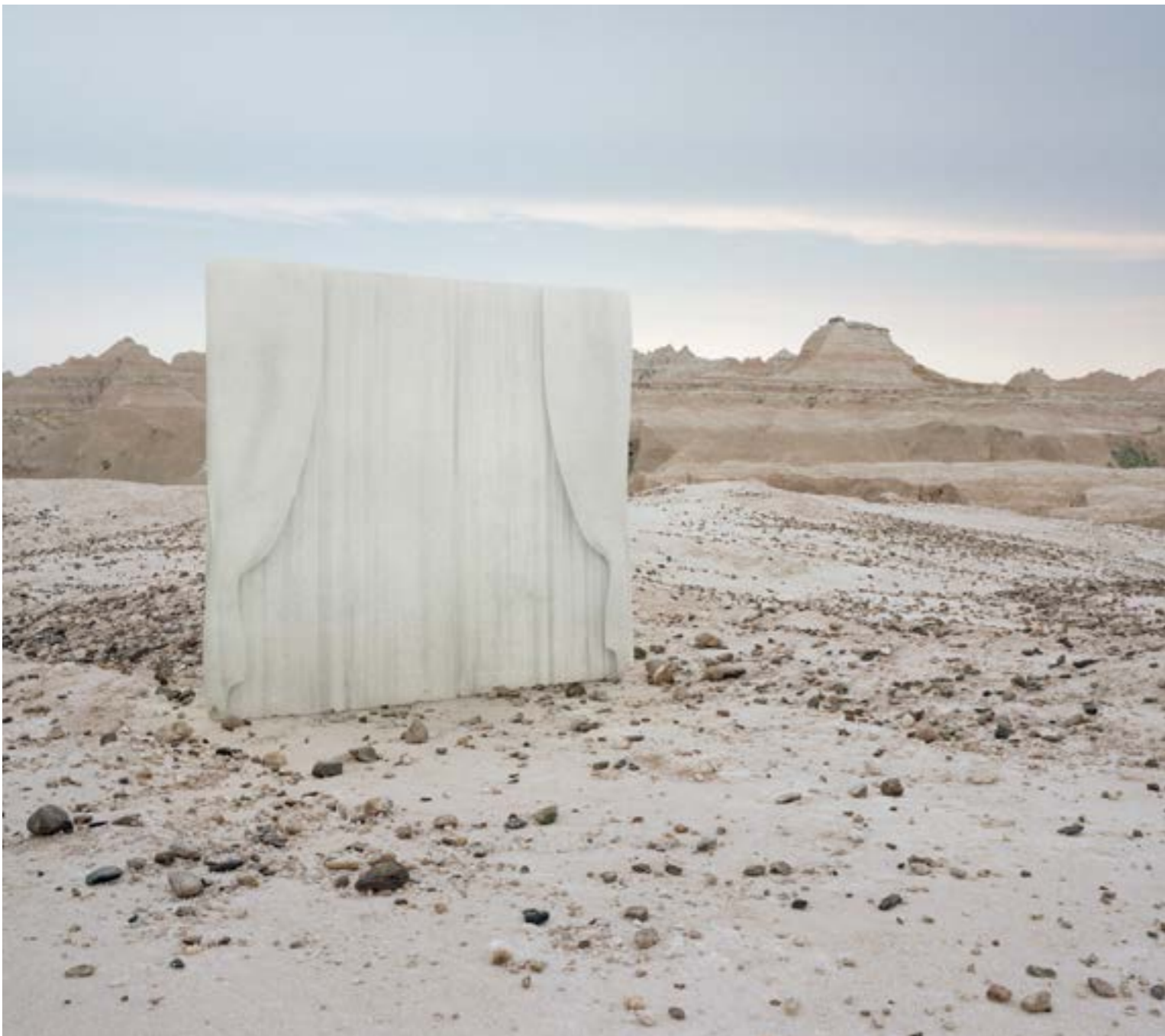
Laurent Pernot, Entracte , 2012 Photographie, épreuve lambda, contre-collage, aluminium, caisse américaine, 80 x 100 cm