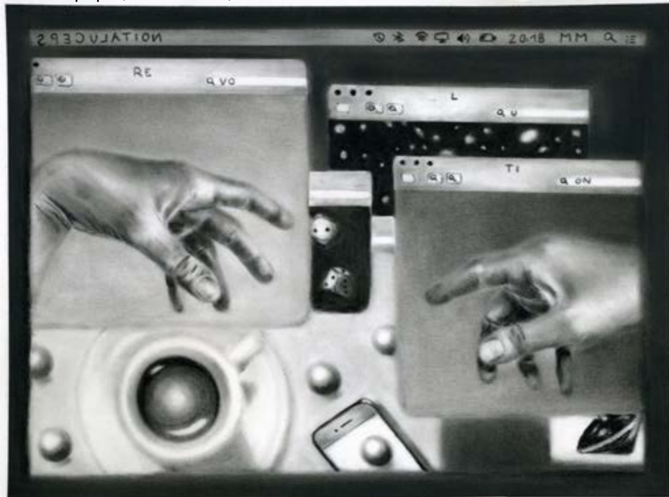
Maud Maffei, Liquid Crystal life series, (SPECULATION / REVOLUTION) , charcoal on paper, 40 x 30 cm, 2018