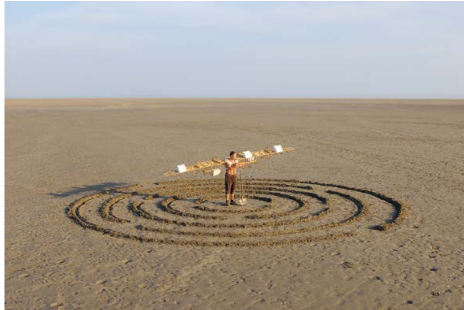
Jean-Michel Pancin, Métadédale , 2014 Tirage jet d'encre pigmentaire, papier blanc fine art, 300 grammes, 74 x 30 cm