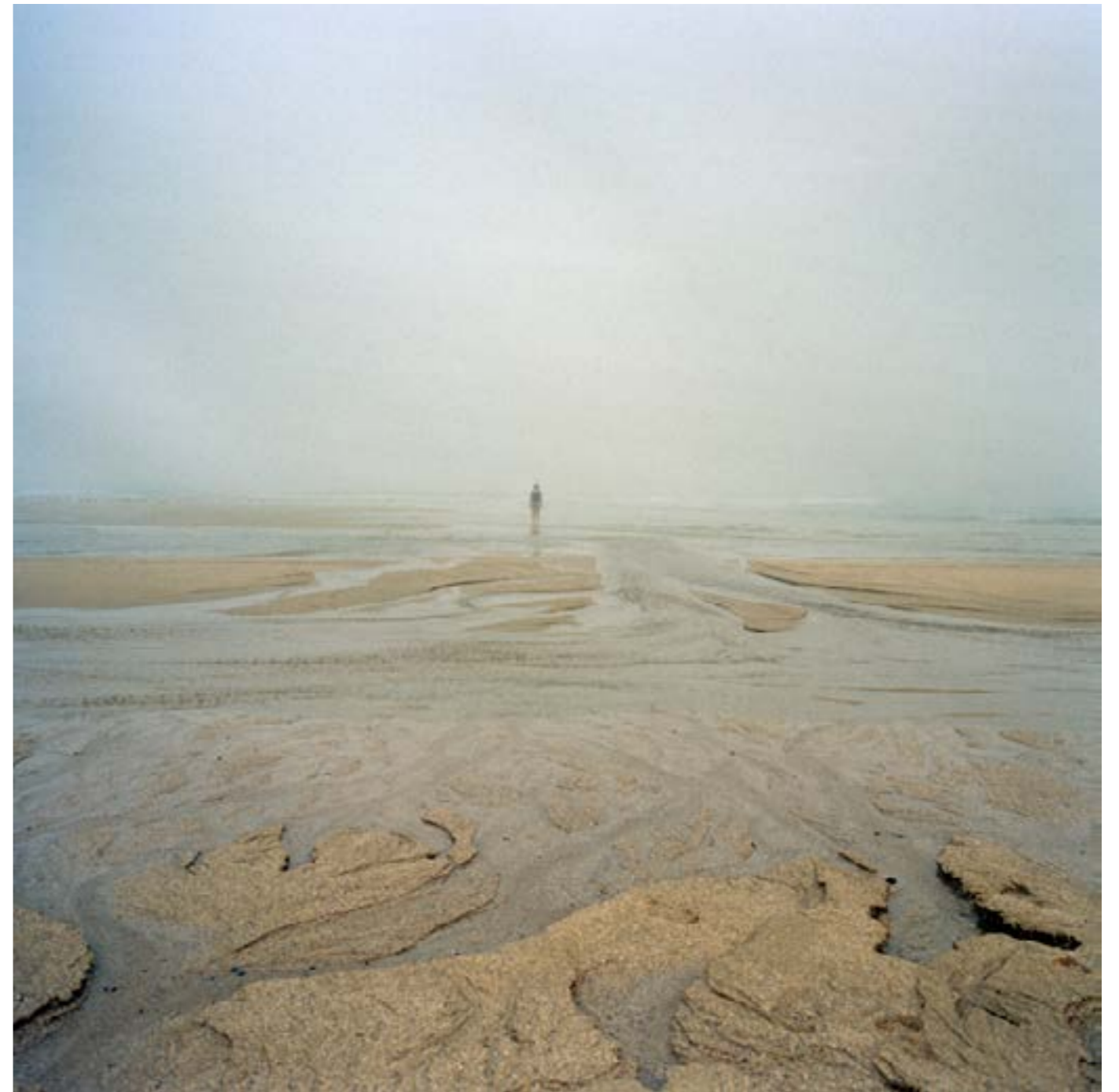
Nina Korhonen, Tide, Galicia , 2004 /2009, Fine art paper inkjet, 100x100