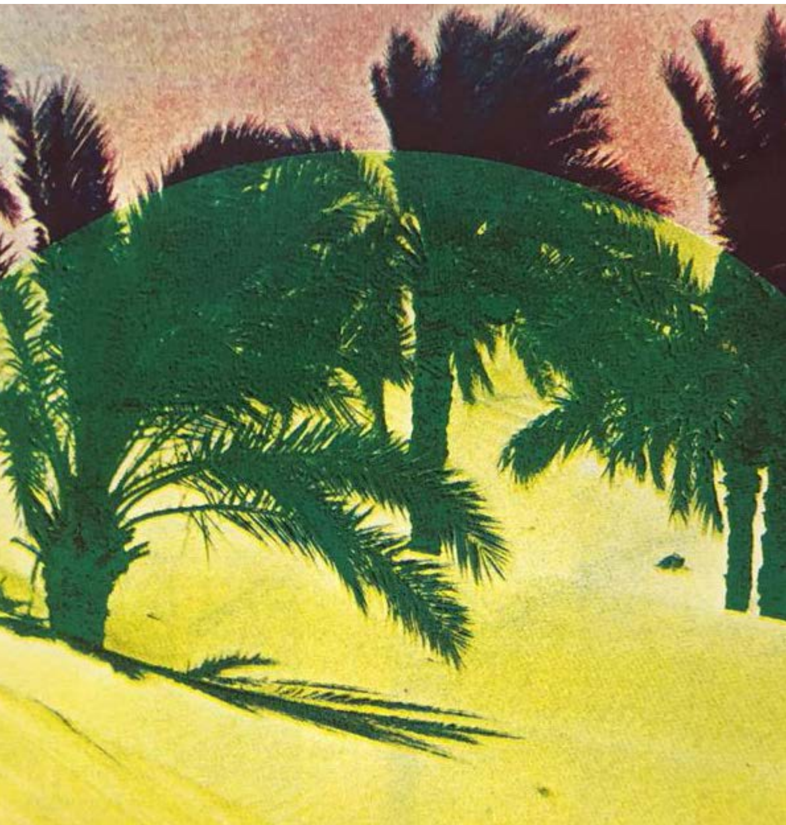
Coraline de Chiara, détail