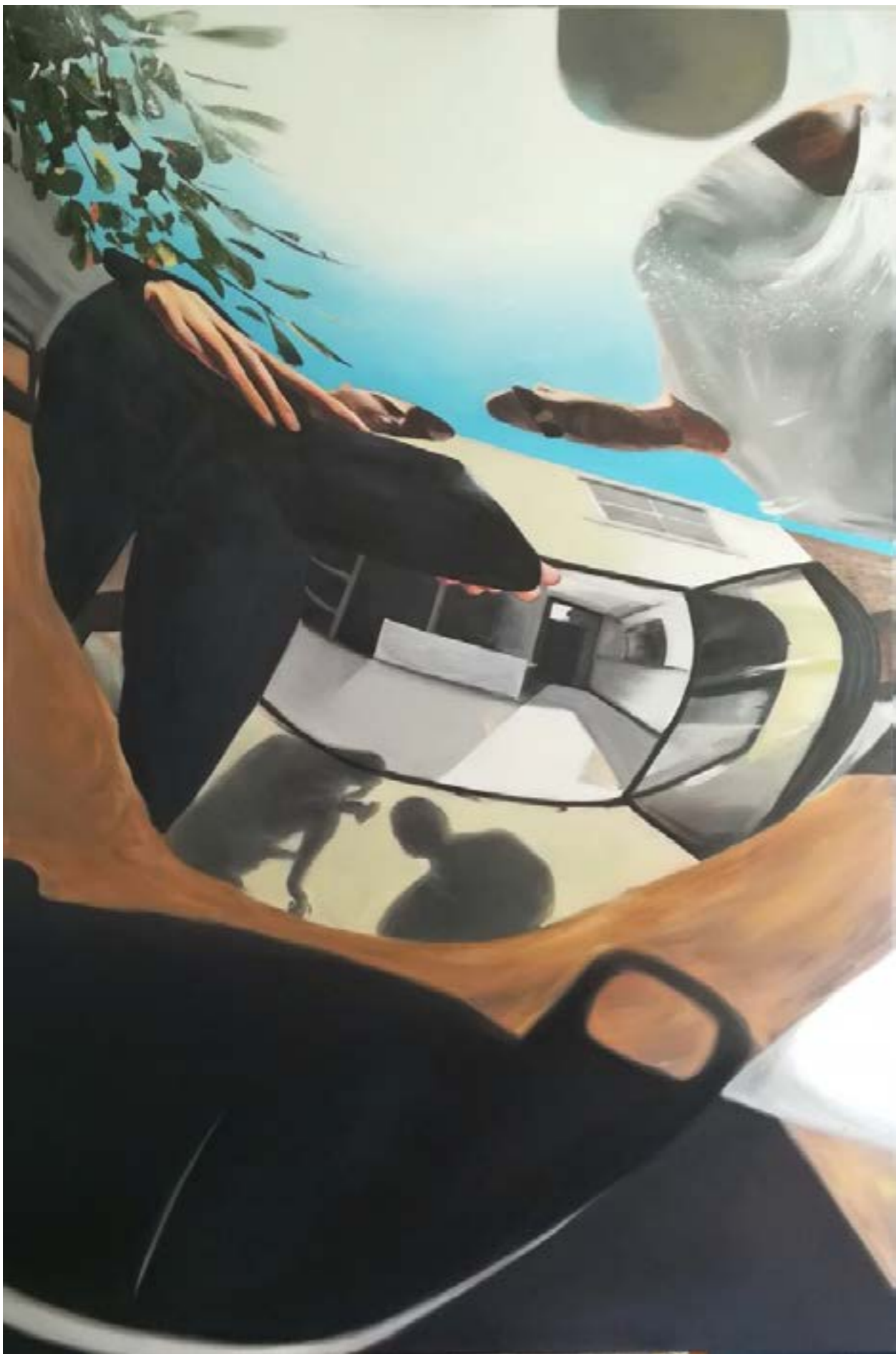
Alexandre Carin, Reflection In a Tea Pot III , Huile sur toile, 165 x 110 cm, 2017