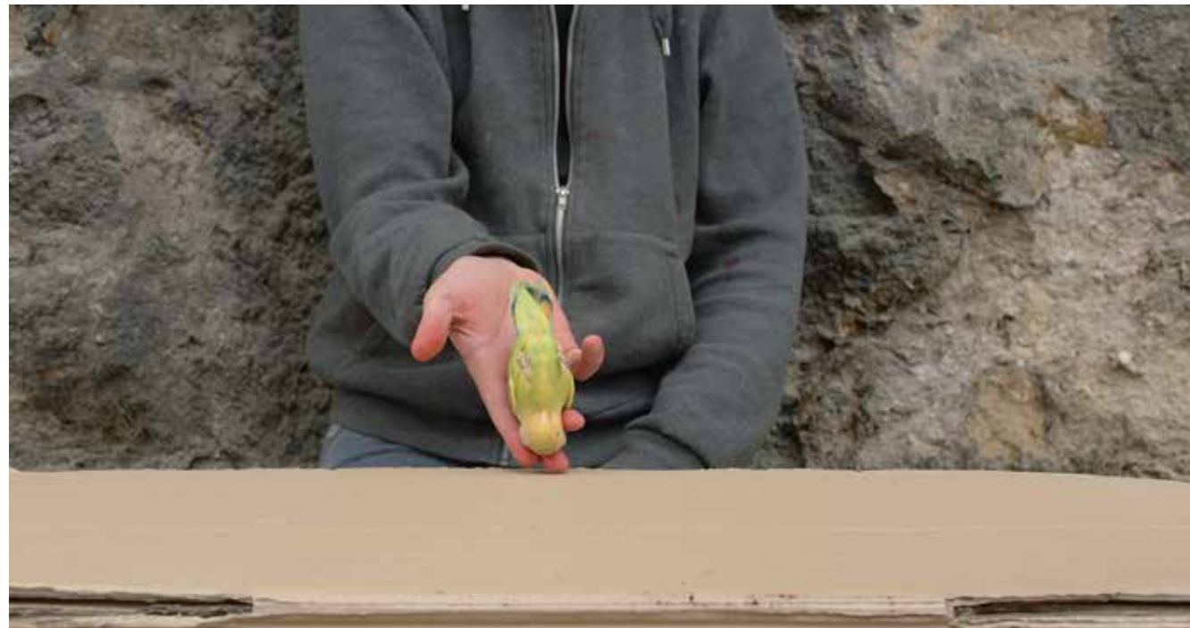
Les Ballons Blancs , vidéogramme, 2015