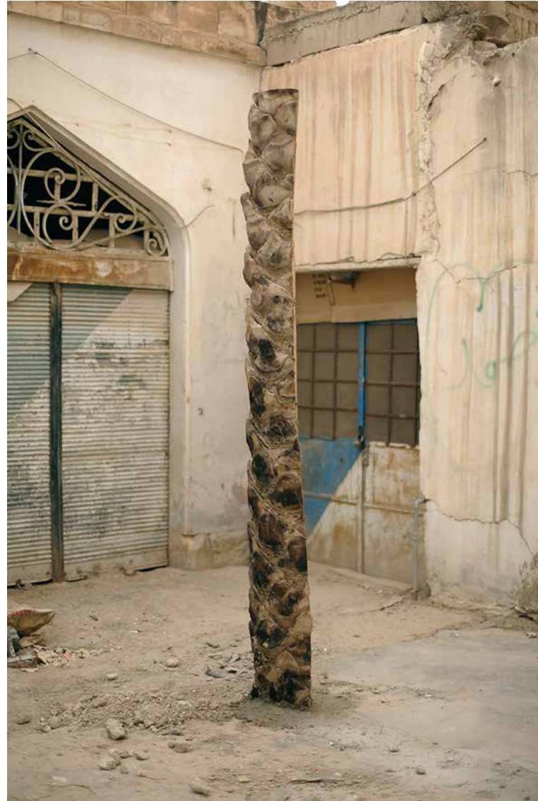
Colonne, Palmyre, photographie, 2003-2014