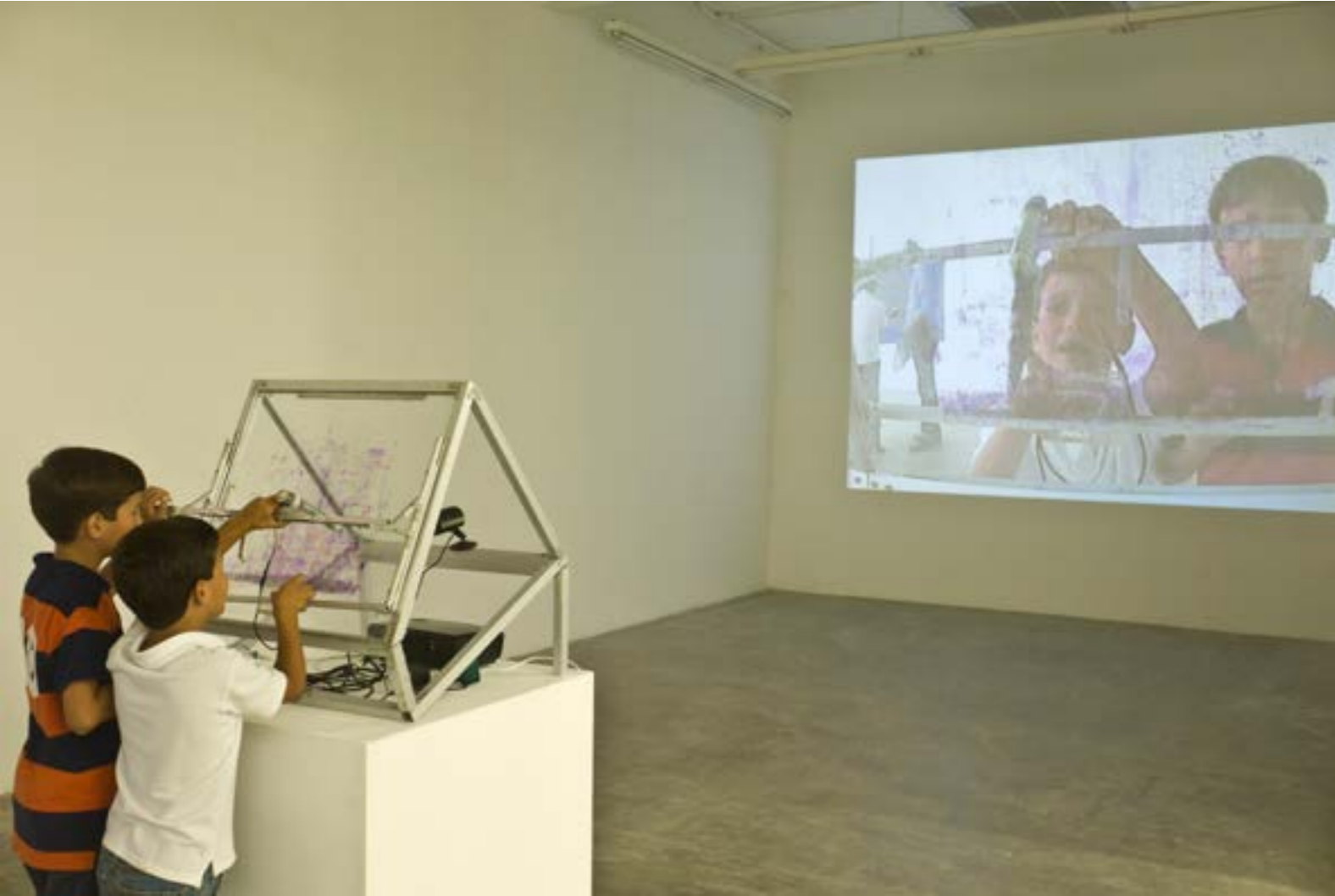
Robot automate 40X40X40cm, 2007