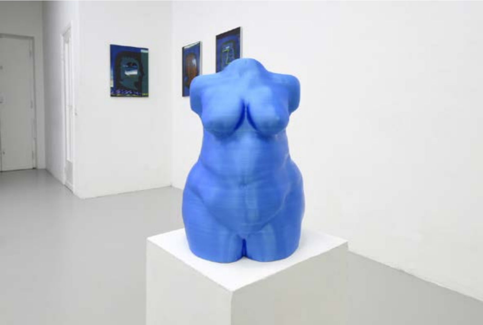
Womans as a Temple, 29x27x40cm, sculpture 3D 201