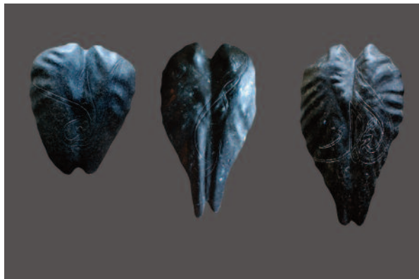
Mehdi Melhaoui | La traversée | 2010 | Passage dos. Dos Horizon, granit noir : 60 x 40 x 15 cm Dos Désert, granit noir : 60 x 30 x 15 cm. Dos Imaginaire : granit noir : 60 x 40 x 15 cm