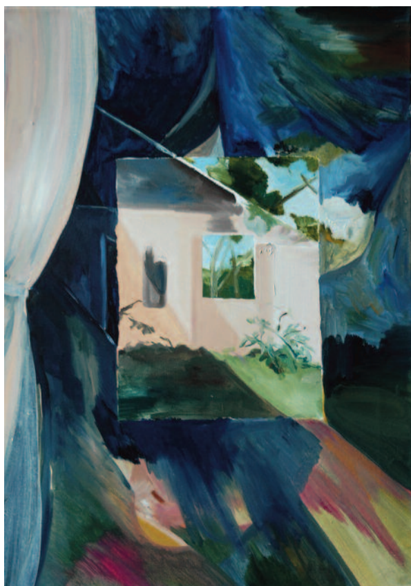
Elisabeth Wedenig | From a window in the open wall | 2011 | Huile sur toile, 70 x 50 cm