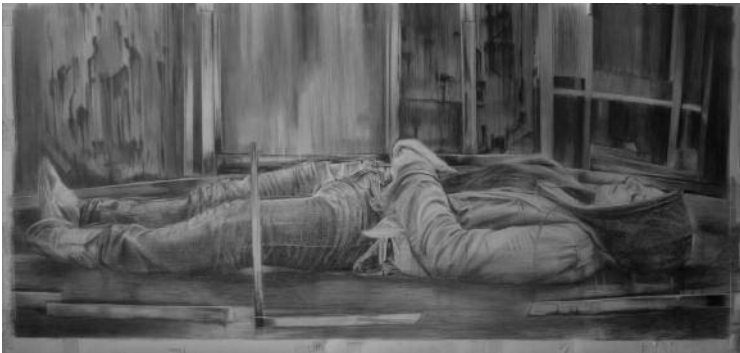
Iris Levasseur | CDC socle | 2012 | Graphite sur papier, 228 x 350 cm Courtesy galerie Odile Ouizeman, Paris