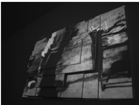
Alan Cicmak | HEIEN Remained Silent | 2009 | Projection vidéo sur support, dimensions variables