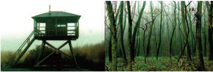
Clément Cogitore | Scènes de chasse | 2009 | Vidéo PAL coul 16/9 - 11min