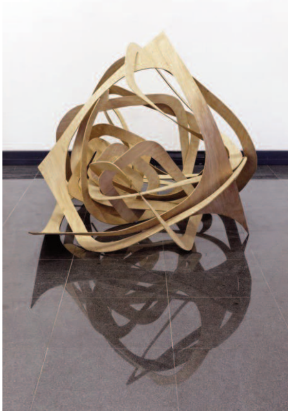
Vincent Mauger | Sans titre | 2007 | Plaque de contreplaqué et serre joint 130 x130 x 150 cm