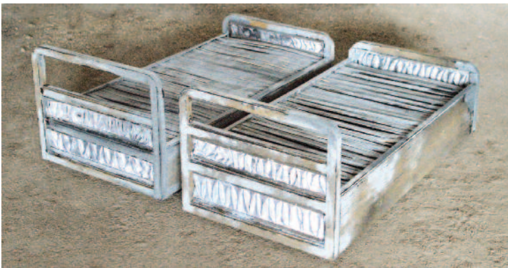
Thomas Gänzler | Sans titre | 2013 | Deux lits en bois, métal, peinture 110 x 55 x 43 cm