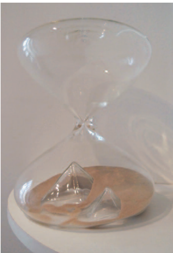
Céline Cléron | Le repos en Egypte | 2013 | Verre soufflé, 36 cm (h) x 25 cm (diamètre). Edition de 5, 1/5