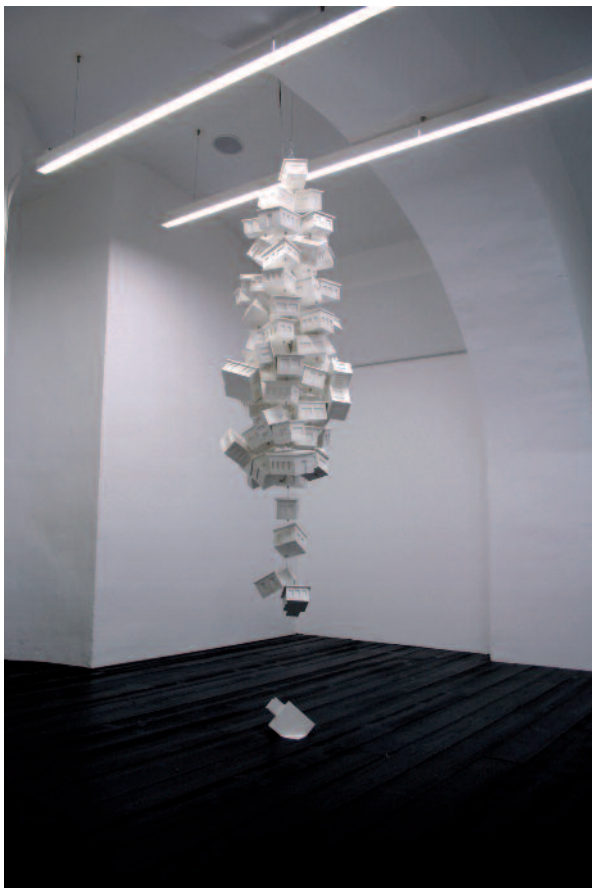
Judith Saupper | Oh, sweet suburbia... | 2011 | Objets en céramique et moteur, 230 x 70 x 60 cm