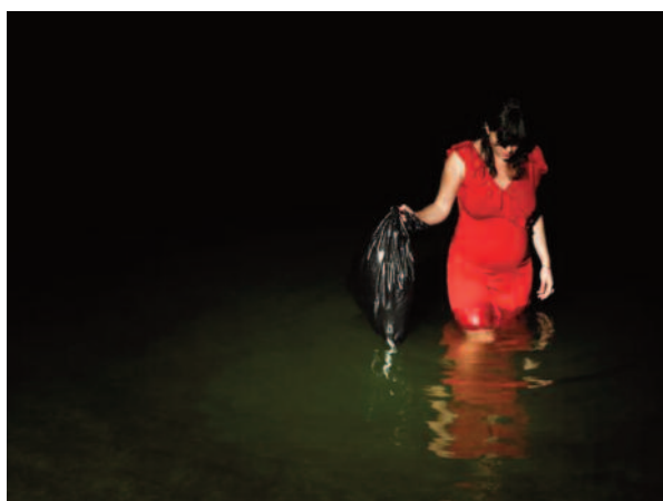
Borjana Ventzislavova | Me and you and them. No one is secure | Photographies 90 x 120 cm